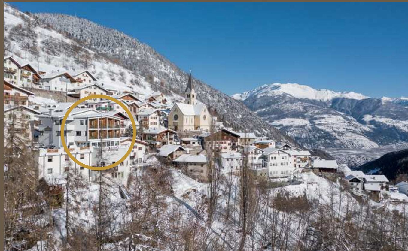
Grafik: ariescreative.com

L'albergo Sonne situato a Stelvio Paese, un caratteristico paesino arroccato sul pendio soleggiato sul quale, così dice la voce del popolo, anche le galline devono mettersi i ramponi. Vivrete una vacanza in natura incontaminata con splendido panorama, calorosa ospitalità, specialità da buongustai e pieno relax.